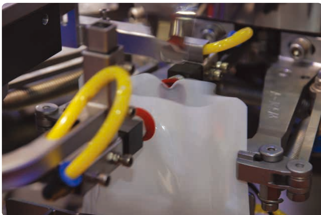
▲ ビニール袋開封 / VB-M シリーズ